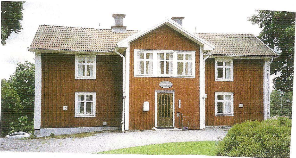
Lilla flygelbyggnaden med gästrum.