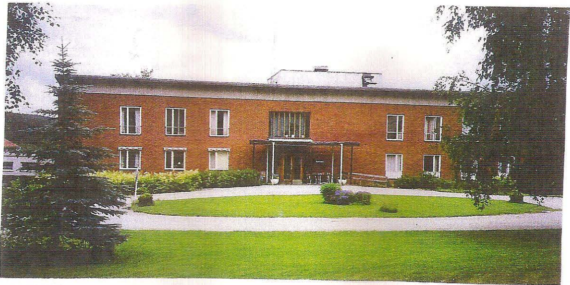
Den nya huvudbyggnaden från 1960-talet med kontorslokaler, läkarmottagning, badavdelningar, ny köksavdelning, gästrum med mera.