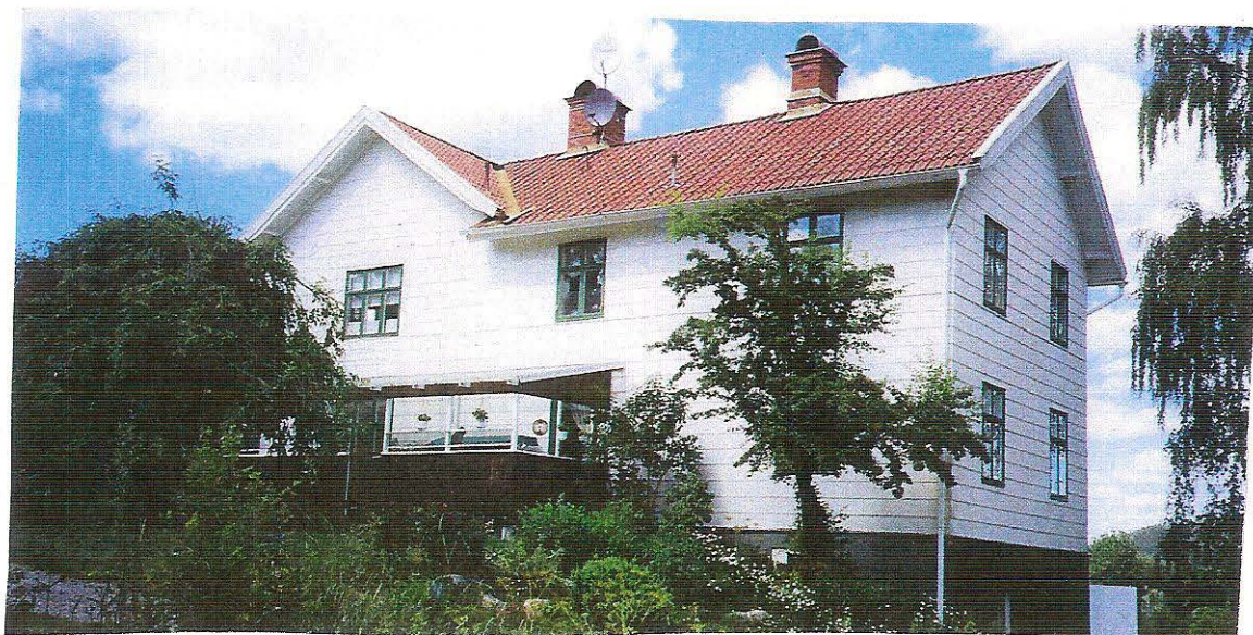
Bergströmsvillan. År 1947 omfattade den kaplanens bostad samt gästrum. Nu ägs villan av en privatfamilj.