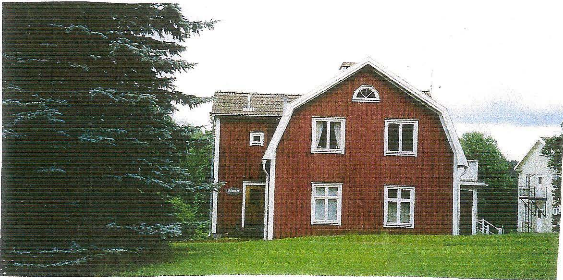
Kontorsbyggnaden där också läkarmottagningen fanns. I övre våningen bodde Nyhyttans kamrer.