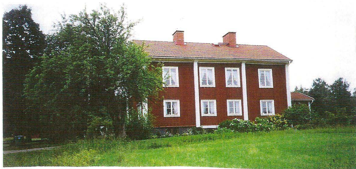
Huset som bröderna Andersson ägde och bodde i. Under högsäsongen hyrde sanatoriet rum i övre våningen för sina gäster.