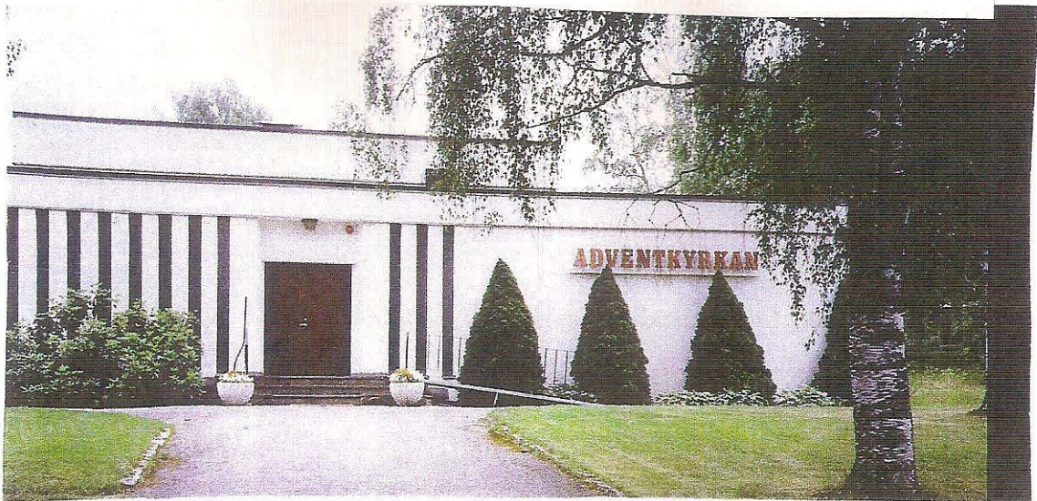
Nyhyttans adventkyrka. Den invigdes 27.2.1961.