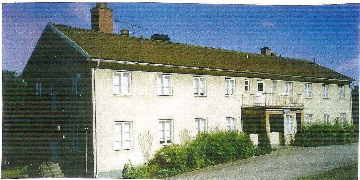
Nyhyttans nya badhusbyggnad blev färdig år 1933.