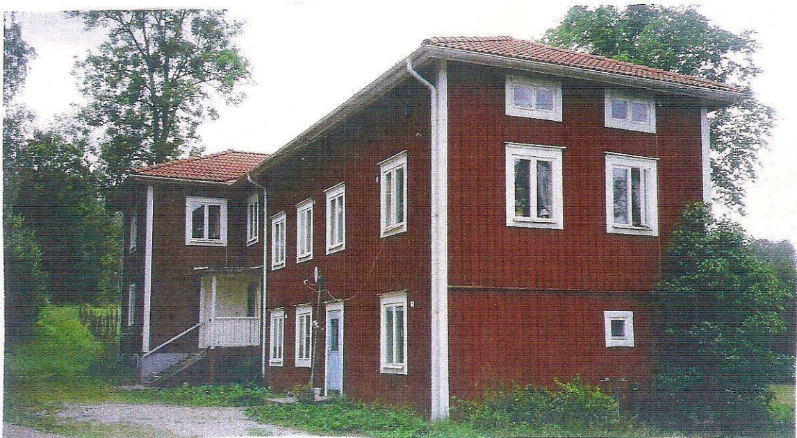
Nyhyttans bybutik på 1940-talet.